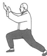
Saisir la queue de l'oiseau