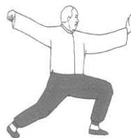
Le simple fouet