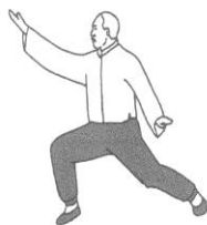
Le vol oblique